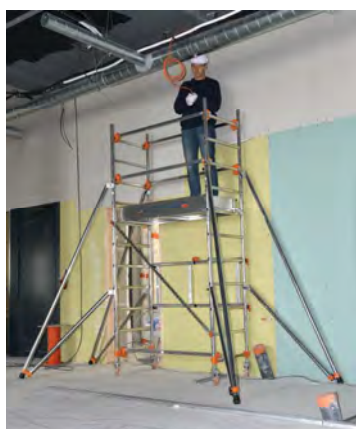
AL135 version base pliante Hauteur travail 3.80 m