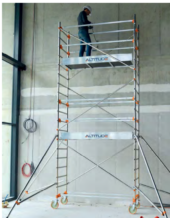
AL205 version standard Hauteur travail 5.90 m