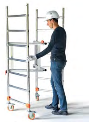
Installation express de la base pliante