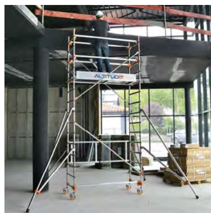
AL165 version base pliante Hauteur travail 4.80 m